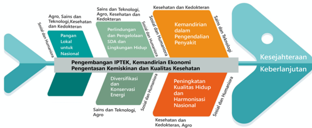
Gambar 1.1 Diagram Hipotesis Arah Pengabdian Pada Masyarakat Unpad Klaster Ilmu-Ilmu Alam, Agrokompleks, Humaniora, dan Kesehatan

Berdasarkan hal tersebut, Universitas Padjadjaran (Unpad) memberikan hibah Pengabdian pada Masyarakat “Unpad Bermanfaat”. PPM “Unpad Bermanfaat” merupakan hibah kompetitif yang didasari pemikiran bahwa setiap fakultas di lingkungan Unpad memiliki peran yang sangat penting dalam pengembangan ilmu interdisiplin dan pengembangan road map penelitian, yang kemudian diintegrasikan dalam tri dharma perguruan tinggi. Program ini memfasilitasi seluruh fakultas di lingkungan Unpad untuk merancang dan mengembangkan program dan kegiatan PPM sesuai dengan perkembangan terbaru di dunia pendidikan nasional dan internasional. Hibah PPM “Unpad Bermanfaat” dilaksanakan dalam jangka waktu selama tiga tahun secara konsisten dan berkelanjutan pada desa-desa binaan Unpad atau lokasi lain yang sesuai dengan prioritas Unpad atau fakultas terkait.